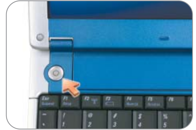
4 Power Button Bouton d'alimentation Botón de encendido