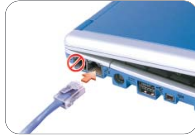
3 Network Réseau Red