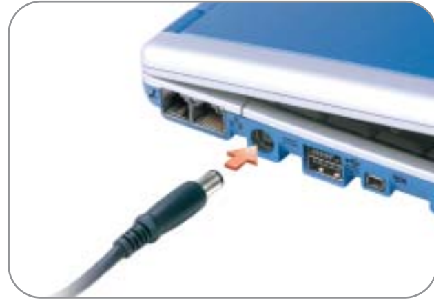
1 AC Adapter Adaptateur CA/CC Adaptador de CA

Antes de instalar y poner en funcionamiento el ordenador Dell™, lea y siga las instrucciones de seguridad del Manual del propietario . Asimismo, consulte este manual para obtener una lista completa de características.