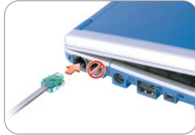
2 Modem (optional) Modem (en option) Módem (opcional)